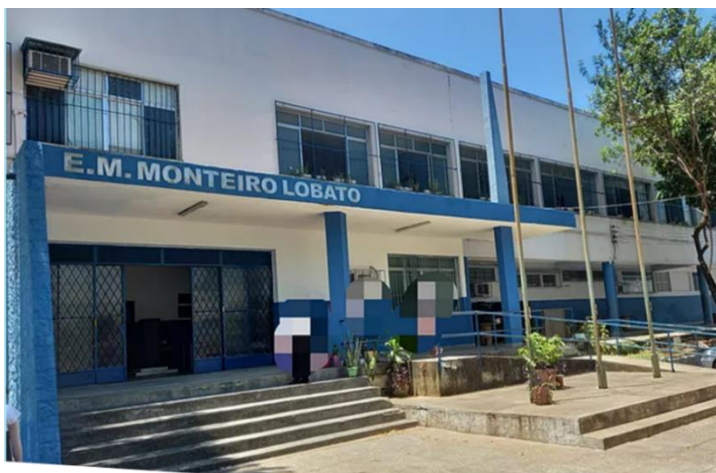
fig.03. Frente do Bloco A da Escola Municipal Monteiro Lobato