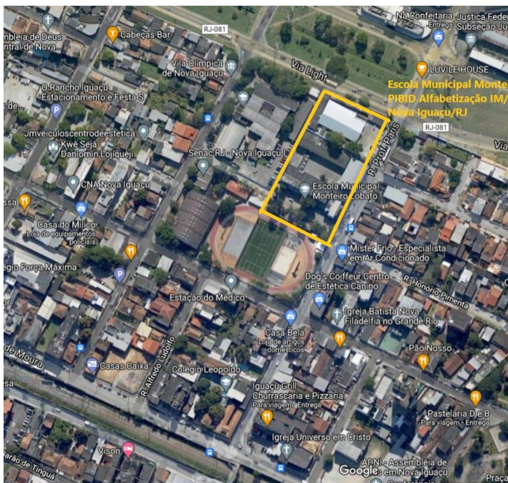
Fig.01. Localização da Escola Municipal Monteiro Lobato