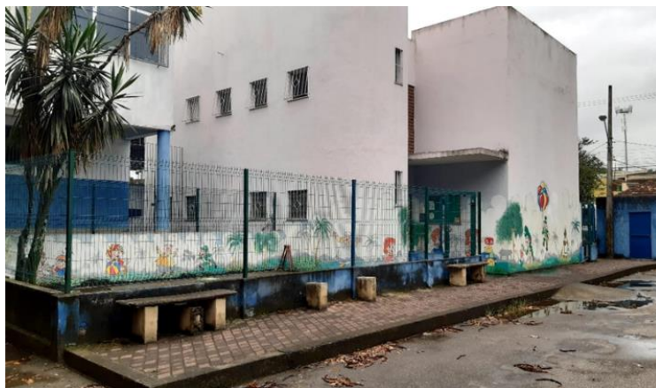
Fig. 04. Bloco D – Educação Infantil