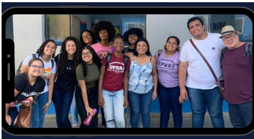
Fig. 05. Parte da Equipe do Pibid Pedagogia UFRRJ Nova Iguaçu na Escola Municipal Monteiro Lobato