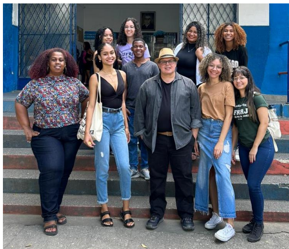
Fig. 06. Parte da Equipe do Pibid Pedagogia UFRRJ Nova Iguaçu na Escola Municipal Monteiro Lobato