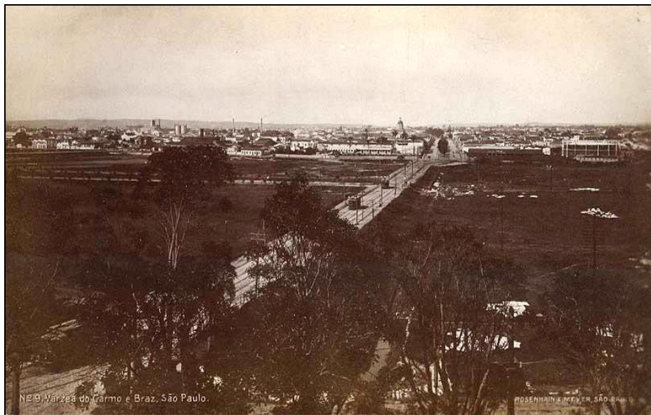
Cartão Postal Várzea do Carmo e Braz, São Paulo – ED. ROSENHAIN & MEYER (sem data). – Várzea do Carmo cortada pelo Aterrado do Brás. Ao fundo o Bairro do Brás. À direita o Gasômetro.