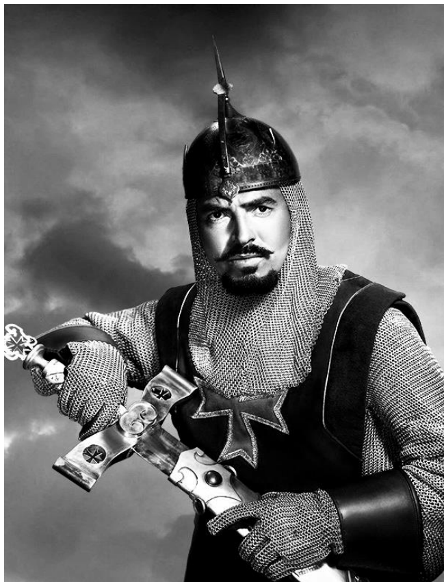
James Mason como Sir Brack em Prince Valiant (1954).