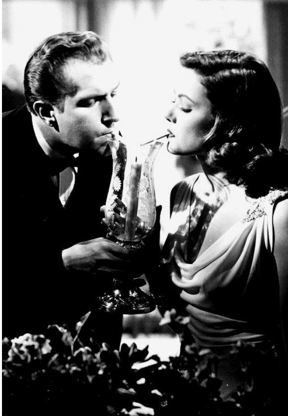
Capa: Gene Tierney e Vincent Price em Laura (1944), drama de mistério e suspense do subgênero noir assinado pelo diretor Otto Preminger.