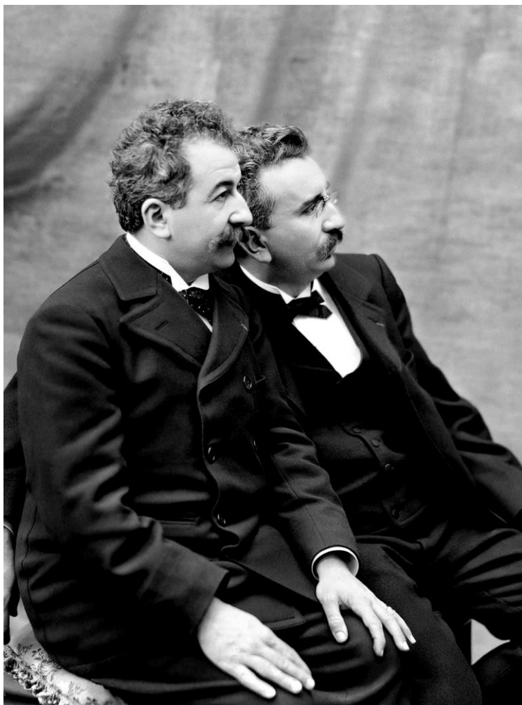
Os irmãos Auguste e Louis Lumière, empresários franceses celebrizados como os criadores do cinema.