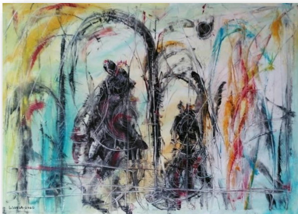
“Movimentos na Ria” – L. Sousa | Janeiro | 2023

P oder-se-ia dizer, uma pintura macabra, visto que, esses animais eram sempre desenhados destruindo o corpo de um homem, ora mordendo o calcanhar dele, outras arrastando-o pelo mato. A presença desse homem, deu outra pista para a equipe, sinal que Jenice passou parte do tempo acompanhada. Quem era aquele homem? Nessa representação, ela passou a delirar, seu choro era sofrido, e vez por outra, ela emitia sons baixos que eles não conseguiam entender. Foram inúmeros os desenhos que ela iniciava e desistia, devido ao retorno à posição depressiva 11 levando-a a deixar os desenhos de lado.