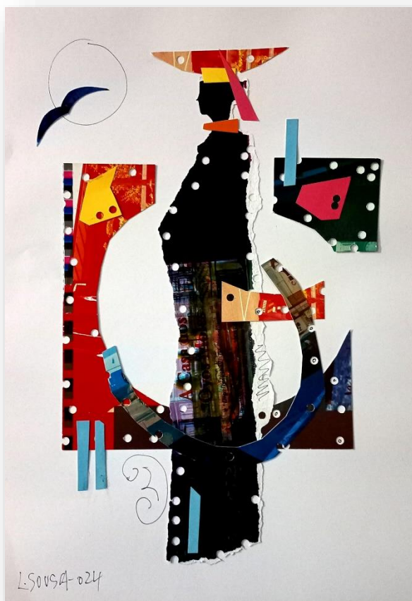
“Mulher grávida/figurações” – Técnica mista L. Sousa janeiro | 2024

– Não. foi um milagre você ter sobrevivido a esse catifeiro. Quando você chegou já estava em processo uma infecção que nos obrigou a retirar seu útero. – Fizemos o possível. Por sorte não lhe perdemos também. Foram muitos meses em coma induzido. – Então, o que você descobriu ou percebera sobre o comportamento dos cães e dos lobos? Desculpe. Deseja falar mais alguma coisa? Quer continuar? – O senhor quer mesmo saber?