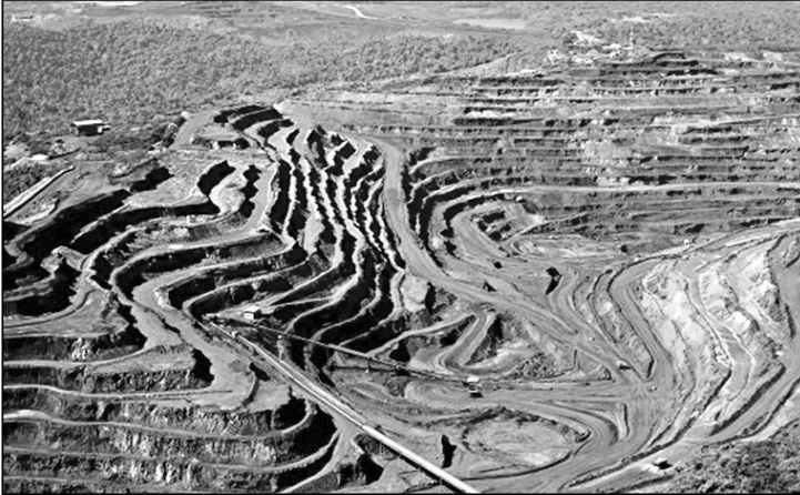
Repare no desenho delicado das linhas, no seu gentil paralelismo, no atlético mergulho até o fundo, na mansa convivência com a mata e o rio logo atrás.

A mineração é um triunfo, antes de ser um sucesso. Aquela excitação visionária enquanto a planta industrial é construída. As explicações sóbrias e técnicas quando algo dá errado, mortes e perdas. O aplauso midiático quando enfim surge a onda parda, vertendo minério da entranha da terra. Então aparece o mercado, para explicar a volatilidade dos preços, que causa euforia e depressão, desemprego e desesperança.