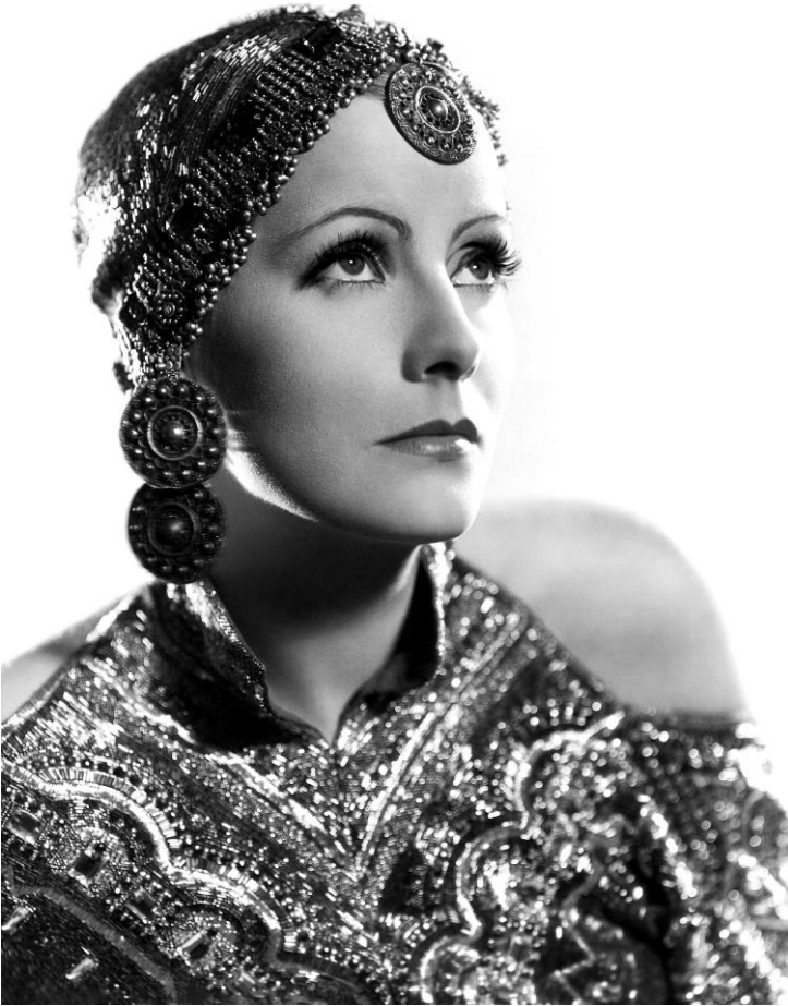
Capa: Greta Garbo personificando a dançarina e espiã neerlandesa Mata Hari em Mata Hari (1931), drama biográfico assinado pelo diretor George Fitzmaurice.