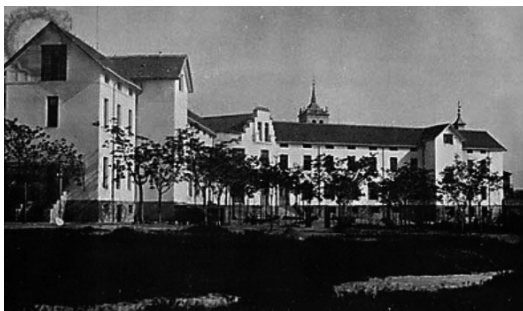
Vista parcial del Manicomio de Ciempozuelos en los años del 1930

Pasa después el Arquitecto-Presidente a glosar someramente su proyecto, este no se hizo realidad, pero sirvió para realizar el proyecto que se materializó en parte unos años más tarde, y que en líneas generales persiste en la actualidad.