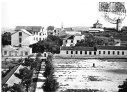
El Manicomio de Ciempozuelos en el 1930

Uno para vivienda de la comunidad, y fuera de este recinto, pero cerca de él, dos pabellones destinados a talleres