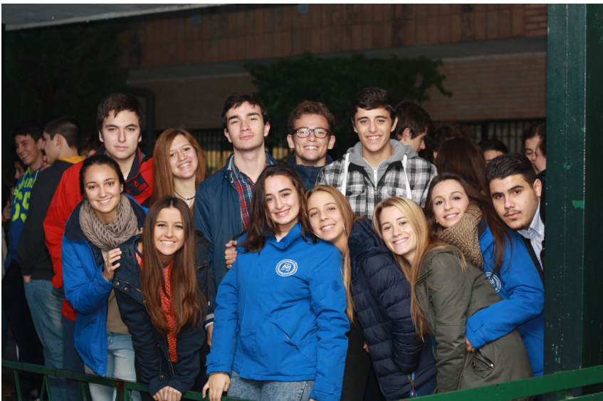
Alumnos de 2º de Bachillerato durante la festividad de Calasanz de 2015 en Montequinto