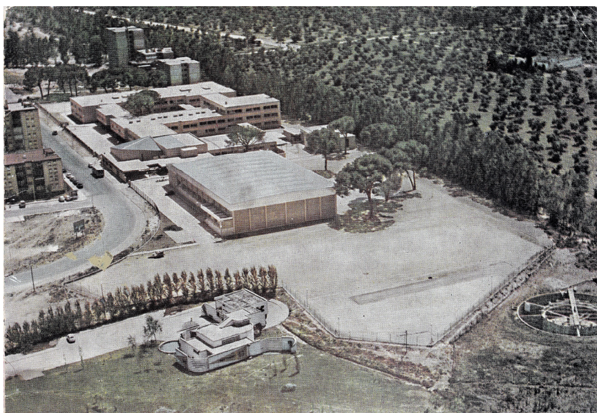
Vista aérea del Colegio Calasancio Hispalense en 1974, el año de su traslado a Montequinto