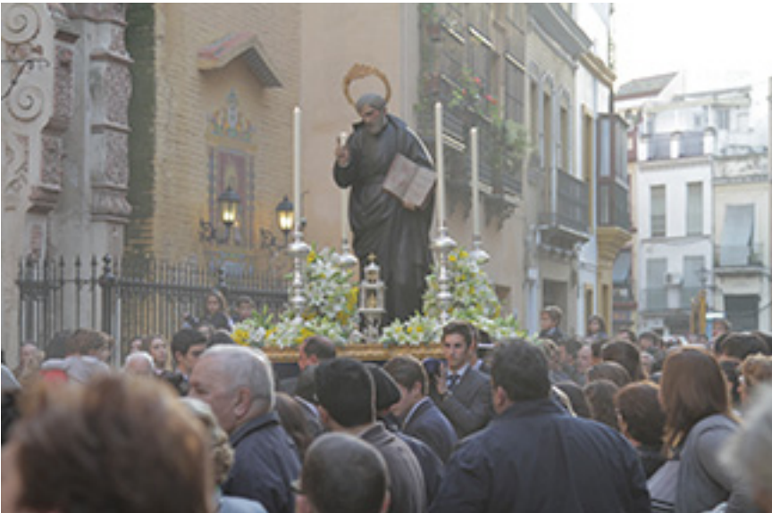
El paso de San José de Calasanz, a la salida de Los Terceros durante la procesión con motivo del 125 aniversario de los Escolapios en Sevilla