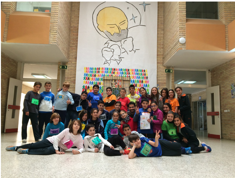
El lema del 125 aniversario de la llegada de los Escolapios a Sevilla, desplegado en Montequinto y un grupo de alumnos junto al pedestal de la figura de Calasanz, desplazada a la Catedral.