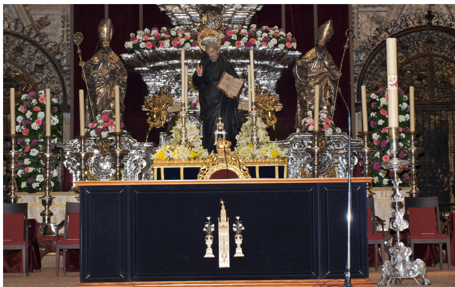
San José de Calasanz presidiendo el altar instalado en la Catedral con motivo 125 aniversario