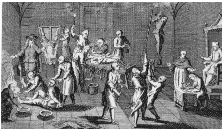
Tipos de torturas nas dependências da Inquisição, como o potro (à esquerda) e a polé (à direita), realizadas na presença de um inquisidor, um notário e um médico. Gravura do século XVIII.

As penas variavam, iam da fogueira às “penas espirituais” (reintegração à fé e orações). Outras penas eram a prisão perpétua, trabalhos forçados e degredo. Vários prisioneiros morriam no cárcere devido às condições insalubres. As torturas eram bem regulamentadas e aconteciam na presença de um médico que controlava até o nível em que a vítima suportaria a punição, porque a Inquisição não queria derramamento de sangue, nem que o torturado morresse. Um notário acompanhava a sessão anotando até os gritos de dor do supliciado. Antes das torturas, a vítima era cinicamente obrigada a assinar um termo de responsabilidade pela punição que receberia. O regimento de 1640 permitia o uso de terríveis instrumentos de tortura como a polé e o potro . A tortura física era mais utilizada nos casos de religião, como os judaizantes, e menos habitual nos chamados “desvios morais”. Na época, na