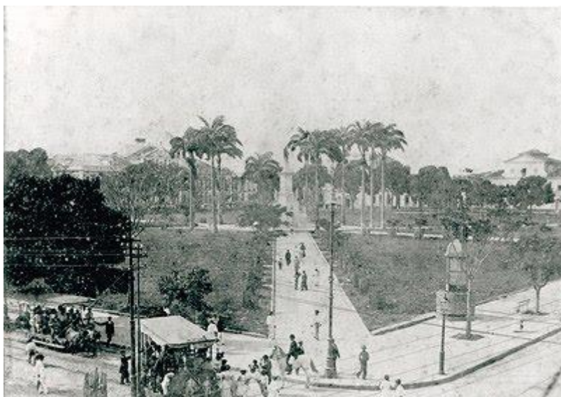
Domínio Público. Belém à época da cabanagem.