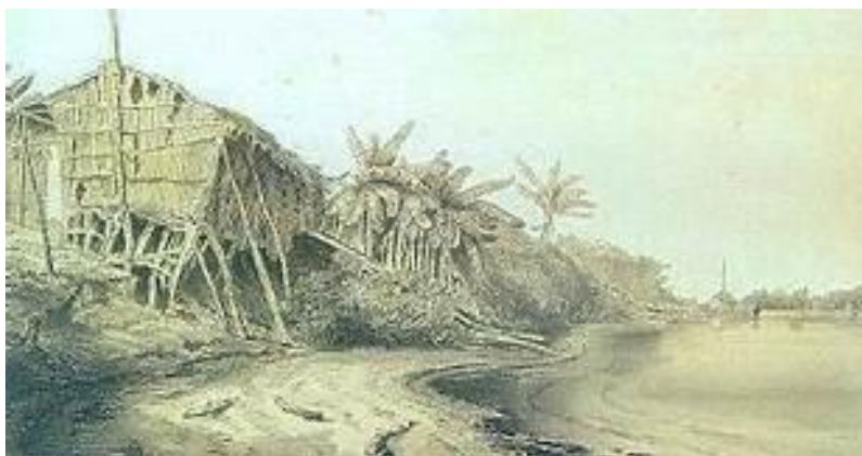
Os cabanos viviam precariamente e almejavam melhores condições de vida.

comerciantes estavam insatisfeito com o tratamento recebido por parte do governo central. Além disso, sofriam com a repressão do Governador Bernardo Lobo de Sousa desde 1833, que ordenou deportações e prisões arbitrárias para quem se opusesse a ele. Assim, em agosto de 1835, os cabanos se amotinam, sob a liderança dos fazendeiros Félix Clemente Malcher e Francisco Vinagre , culminando na execução do Governador Bernardo Lobo de Sousa.