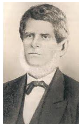
Eduardo Francisco Nogueira Angelim presidente cabano.

A presidência da província passou a ser ocupada pelo revolucionário Felix Antônio Clemente Malcher. Contudo, Clemente Malcher se revela um farsante e tenta reprimir os revoltosos, mandando prender Eduardo Angelim , um dos líderes do movimento. Os rebeldes – que eram apelidados cabanos – tentaram evitar que a regência nomeasse novo presidente para a província: somente aceitariam um ocupante para o cargo indicado pelo imperador quando este assumisse o governo. Algum tempo depois, Malcher foi assassinado, assumindo então a presidência do Grão-Pará Francisco Pedro Vinagre.