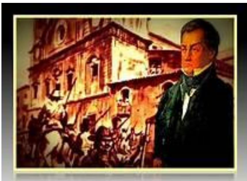
Diogo Antônio Feijó e a cabanagem.