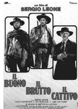
15–17 Die Dollar-Trilogie: FÜR EINE HANDVOLL DOLLAR, FÜR EIN PAAR DOLLAR MEHR, ZWEI GLORREICHE HALUNKEN (ital. Filmplakate)