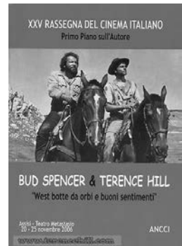
4 Festschrift zum 25. Festival Primo Piane sull'Autore