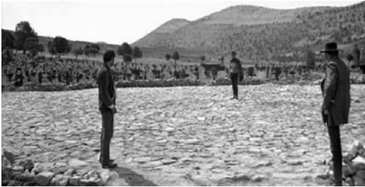
18 Das legendäre Triell am Ende von ZWEI GLORREICHE HALUNKEN

immer schon gewesen war: zu einem zwar faszinierenden, doch narrativ höchst simpel gestrickten Puppentheater. 26