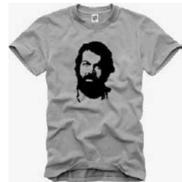
3 Bud-Spencer-T-Shirt im Che-Guevara-Style