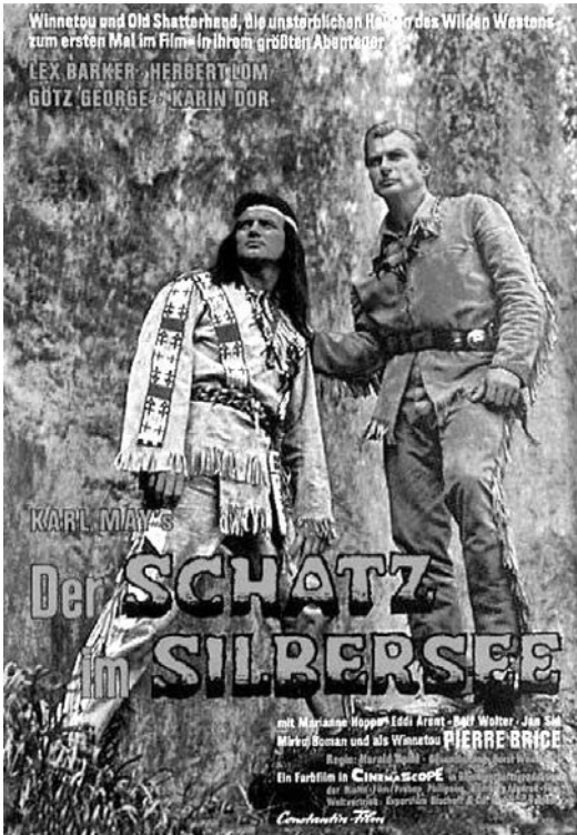
12 Pierre Brice und Lex Barker in DER SCHATZ IM SILBERSEE (deutsches Filmplakat)

«von gar messianischer Größe» 20 , dessen Leinwandtod in WINNETOU III (BRD/JUG 1965, R: Harald Reinl) die Nation erschütterte und den Produzenten eine wahre Flut von Protestbriefen einbrachte. «Einen edleren, stolzeren und schöneren Indianer», vermerkt der Filmkritiker Thomas Klein, «soll es davor und danach nicht