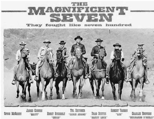
10 Heldentum gegen Zahlschein: DIE GLORREICHEN SIEBEN (US-Filmplakat)

Durch dieses Bekenntnis wird LIBERTY VALANCE zu einem Meta-Western: Indem das Genre seinen realitätsfernen Charakter nicht länger verleugnete, reflektierte es sich selbst und offenbarte sich als mythopoetische Narration jenseits historischer Authentizitäten. Damit aber war es mit seinen Geschichten bereits selbst Historie geworden. Konsequenterweise waren die Helden in den späten Westernfilmen nahezu allesamt alte Männer – Männer, die ihre besten Tage bereits hinter sich wussten, die kaum mehr in den Sattel kamen und zum Schießen eine Brille be-