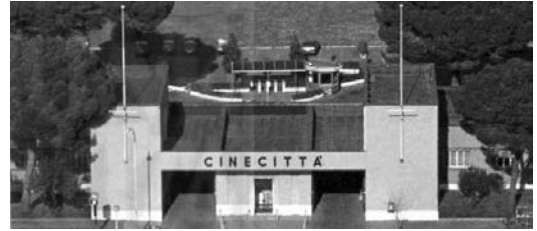
20 Die Pforten von Cinecittà

Ähnlich den populären Massenkinos in Brasilien, Mexiko, Ägypten, Hongkong oder Bombay war das römische Cinecittà-Studiosystem seit seinen Anfängen auf breitenwirksame Stoffe ohne größeren Anspruch abonniert. Die Studios waren Mitte der 1930er-Jahre an der Peripherie der italienischen