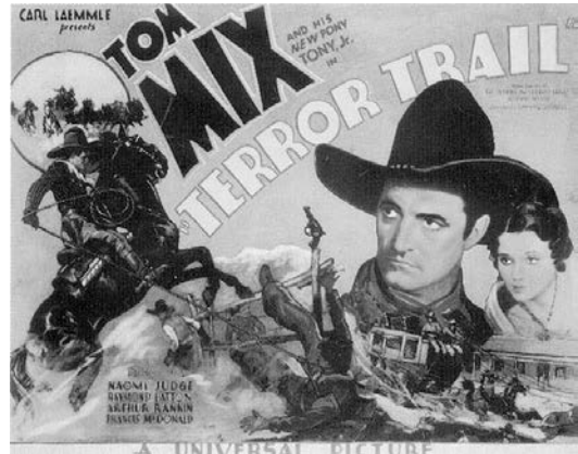
6 Knallbuntes Spektakel: Plakat zu einem typischen Tom-Mix-Streifen

siedelte Land gab es in den 1960er-Jahren nicht mehr, ebenso wenig wie den zu fürchtenden Indianer, der längst assimiliert war oder in kleinen Reservaten sein elendes Leben fristete. Auch die in weiten Teilen abgeschlossene Neuordnung der Geschlechterrollen traf den traditionell patriarchalisch strukturierten Western schwer, da sie ihm die Frau als passives Objekt männlicher Rivalitäten entzog. Spätestens seit der Katastrophe des Vietnam-Krieges mussten sich aber dann auch die Männer von der allzu simplen Überzeugung verabschieden, dass eine schussbereite Waffe in der Hand letztlich alles zum Guten wenden würde. Neben dem Mythos der Frontier – einer letzten zu erschließenden Grenze – war dem Western folglich auch das Phantasma einer permanenten «regeneration through violence» für immer verloren gegangen. 11 Damit aber waren die beiden Grundpfeiler seines Wesens gefallen und nicht mehr länger fiktiv zu verhandeln. Mit den kritischen Augen einer neuen, multikulturell und global ausgerichteten Generation betrachtet, wurde der Western inhaltlich fragwürdig, und die Methoden, die er zur Konfliktlösung anbot, untragbar: Lange schon hatte sich die Welt mit ganz anderen, weitreichenderen Problemen zu befassen als mit Zugüberfällen, Viehdiebstählen und Siedlungs-rivalitäten. Das aber war nicht immer so gewesen.