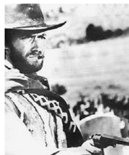
19 Clint Eastwood als «Mann ohne Namen»

Der Humor der Leone-Western resultierte gerade aus der vollkommenen Atmosphäre der Humorlosigkeit, in die sie getaucht waren und die für komische Handlungen faktisch keinerlei Raum ließ. In der Rolle des «Mannes ohne Namen» entwickelte Hauptdarsteller Eastwood dabei einen zynisch abgebrühten Helden-Typus von grotesken Ausmaßen, der selbst dann noch einen coolen Oneliner herauswürgte, wenn er dem Tod ins Auge sah oder gerade selbst mehrere Männer gnadenlos über den Haufen geschossen hatte. Die humoristische Wirkung entstand somit als bewusst einkalkuliertes Nebenprodukt des einschneidenden Demontagevorgangs, mit dem Leone dem nostalgisch-verklärten Blick des amerikanischen Westerns zuleibe rückte. Gerade aus der ausbleibenden emotionalen Betroffenheit resultierte die Eastwoodsche Komik: «Automatismus, Steifheit, erworbene und beibehaltene Gewohnheit, das sind die Dinge, die uns an einer Physiognomie zum Lachen