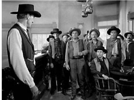
8 Verlorener Held: Gary Cooper (l.) in ZWÖLF UHR MITTAGS

Der Prozess der fortschreitenden Entzauberung des Westens, der die alten, vormals überlebensgroßen Helden sprichwörtlich von ihren hohen Rossen hob, mündete schließlich zu Beginn der 1960er-Jahre in den sogenannten Spätwestern , als dessen Parade-Beispiele Fords DER MANN, DER LIBERTY VALANCE ERSCHOSS (THE MAN WHO SHOT LIBERTY VALANCE, USA 1962) und Sam Peckinpahs SACRAMENTO (RIDE THE HIGH COUNTRY, USA 1962) gelten. Beide Filme künden das Ende der großen Legende vom Good Old West : In John Fords Film kehrt der zu Macht und Ansehen gelangte Senator Ransom Stoddard (James Stewart) am Ende seiner politischen Karriere noch einmal in jene Western-Stadt zurück, in der vor Jahren sein beruflicher Aufstieg begann. Noch immer wird er von den dortigen Einwohnern voller Ehrfurcht als der Mann gefeiert, der im Duell einst den berüchtigten Banditen Liberty Valance (Lee Marvin) erschossen hat. Doch die alte Geschichte beruht – das stellt Stoddard gegenüber Vertretern der Presse nun endlich klar – auf einem Irrglauben. Nicht er hat der Stadt zu Frieden und Sicherheit verholfen, sondern ein Mann namens Tom Doniphon (John Wayne), der ungesehen Schützenhil-