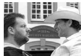
5 Deutsche TV-Hommage: HAMMER & HART