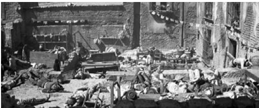
11 Nach dem Massaker in THE WILD BUNCH – SIE KANNTEN KEIN GESETZ

Durch dieses Bekenntnis wird LIBERTY VALANCE zu einem Meta-Western: Indem das Genre seinen realitätsfernen Charakter nicht länger verleugnete, reflektierte es sich selbst und offenbarte sich als mythopoetische Narration jenseits historischer Authentizitäten. Damit aber war es mit seinen Geschichten bereits selbst Historie geworden. Konsequenterweise waren die Helden in den späten Westernfilmen nahezu allesamt alte Männer – Männer, die ihre besten Tage bereits hinter sich wussten, die kaum mehr in den Sattel kamen und zum Schießen eine Brille be-