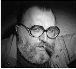
14 Sergio Leone

Leones reduzierten die italienischen Filmemacher das Genre wieder weitgehend auf jene Elemente, aus denen es einst erwachsen war: Action, Tempo und Revolver. Zur einer Zeit, in der der amerikanische Spätwestern einer zunehmend schwermütigen Melancholie anheim fiel und wehmütig den langsamen Abschied von den alten, schon lange allzu vertrauten Legenden zelebrierte, kreierte der Italo-Western eine Welt aus synthetischen Figuren, die mit den traditionellen Genrehelden nur noch wenig gemein hatten. Ausgedient hatten fortan die einsamen, aufopferungsvollen und edelmütigen Cowboys vergangener Tage, die auf der Suche nach guten Taten unentwegt die amerikanische Prärie durchritten, geleitet von nichts anderem als der Gewissheit, dass «a man's gotta do what a man's gotta do» 24 . An ihre Stelle traten seit FÜR EINE HANDVOLL DOLLAR die Kopfgeldjäger und Banditen, Bandenführer und Revolutionäre. Den scheinbar unermesslichen, erhabenen Weiten des amerikanischen Westens folgte als Schauplatz die enge, über die Maßen schmutzige mexikanische Grenzlandschaft des Südens, in der alle Moral längst vakant geworden war.