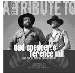
2 Punkrock-Helden: Spencer/Hill-Tribute-CD (2007)

Nun, bevor wir uns an den Versuch einer Beantwortung dieser Frage wagen, seien dem Autor