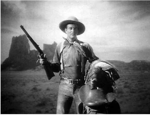
7 Westernheld par excellence: John Wayne in RINGO