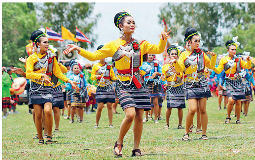
DOHA, THIRAKRANGSRI/SHUTTERSTOCK © IZDA., DANITIA DELMONT/SHUTTERSTOCK ©

► Descubrir costumbres, desde el teñido de telas hasta el adiestramiento de elefantes, en pueblos del noreste. (p. 116)