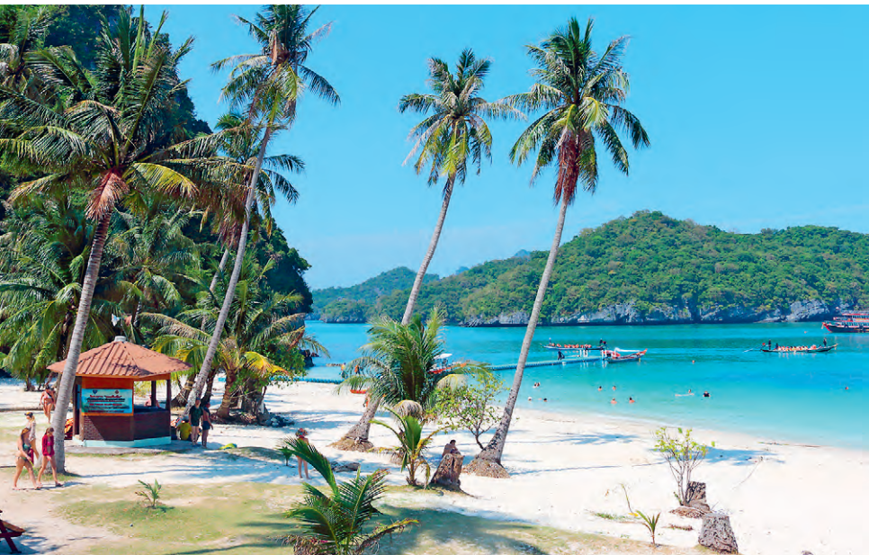
Arriba: Parque Nacional Marino de Ang Thong (p. 224).