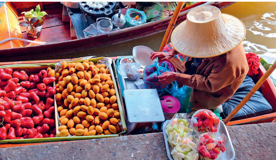
Arriba: mercado flotante de Damnoen Saduak (p. 88).