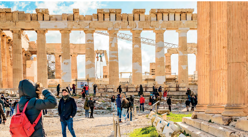
La Acrópolis (p. 62), Atenas.