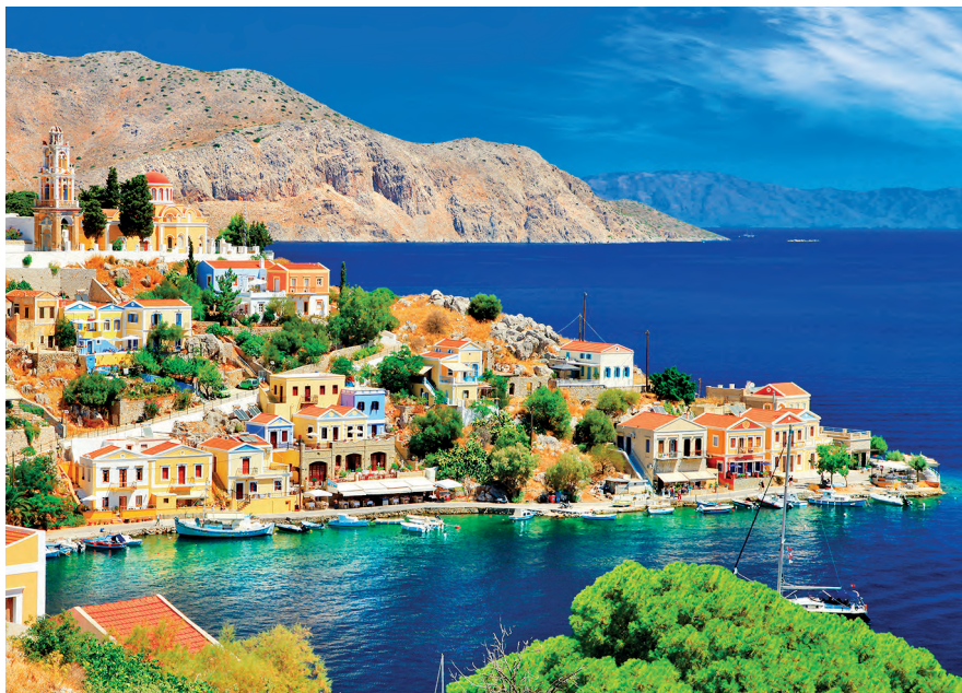
Sými (p. 228), el Dodecaneso.