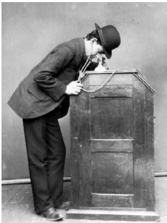
Kinetoscope - Início do século XX.

* Apenas os títulos dos filmes exibidos em território brasileiro aparecem nas filmografias dos atores e atrizes apresentados neste volume.