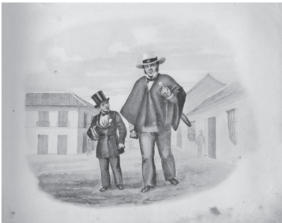
Imagen 1. Provinciano conduciendo a su hijo al colegio

Fuente: Ramón Torres Méndez, “Un provinciano conduciendo á su hijo al colegio. Bogotá [c. 1860]”, en Álbum de costumbres colombianas según dibujos del señor Ramón Torres Méndez . Publicado por la Junta Nacional del Primer Centenario de la Proclamación de la Independencia, editado por Víctor Sperling. Tomado de https://repository.eafit.edu.co/items/2a66a7e0-eb50-4ef5-b3e3-39b4bcd7a3d