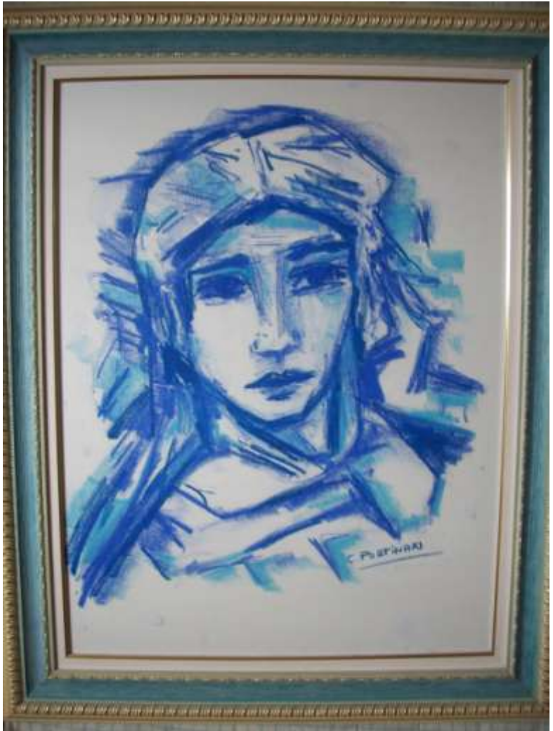
Figura atual de Fagundes Varela, psicopictografada por Germano Rehder, de autoria de Cândido Portinari