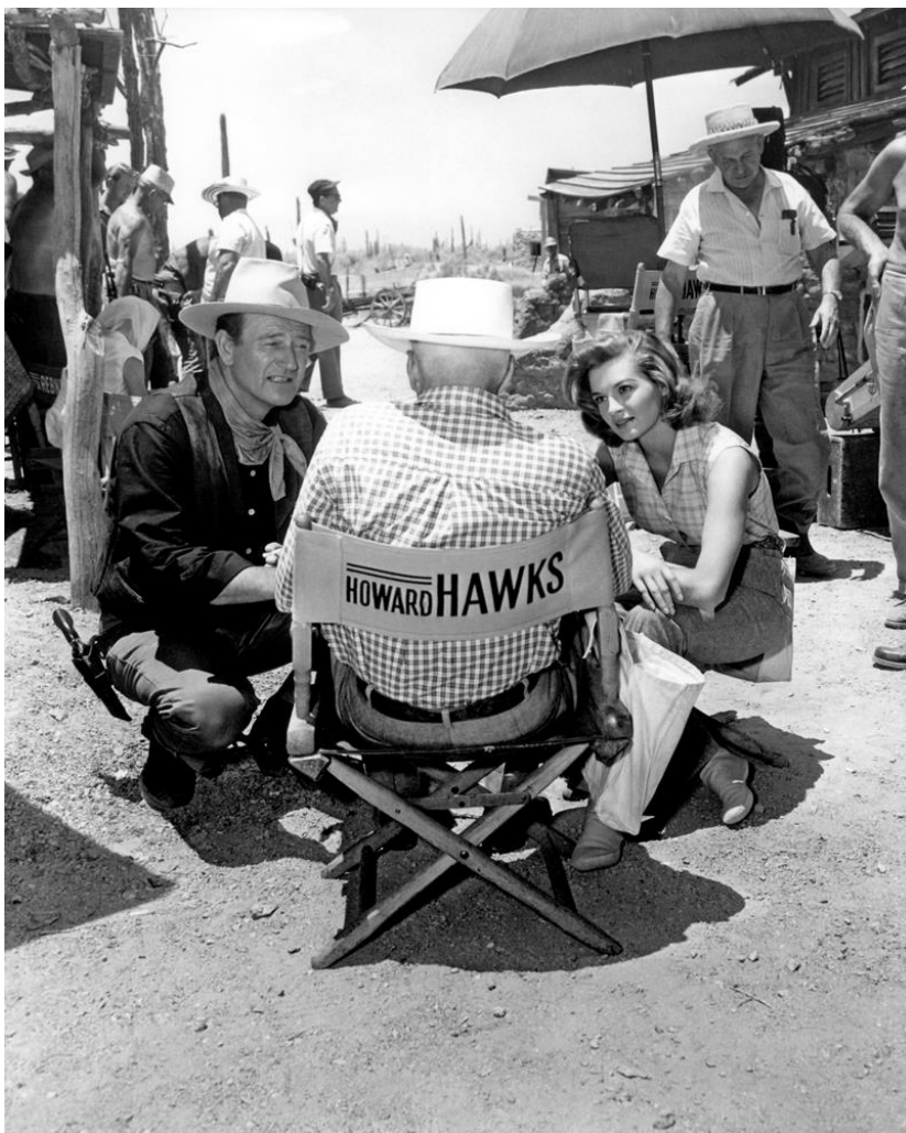
Howard Hawks com John Wayne e Angie Dickinson durante as filmagens de Rio Bravo (1959).