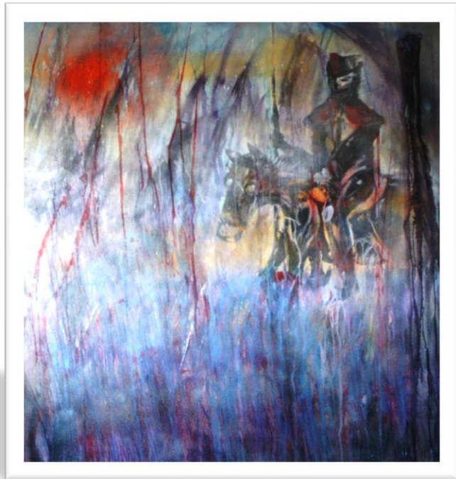
A lenda do cavaleiro perdido