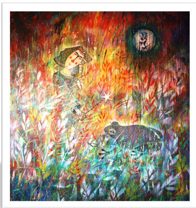
A princesa e o sapo