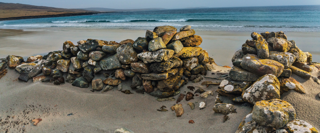
Ruinas de una casa comunal vikinga en las remotas costas de las islas Shetland.

de jefe vikingo y las familias remiendan sacos de arpillera para las antorchas, construyen cascos y fabrican, tablón a tablón, un barco vikingo completo.