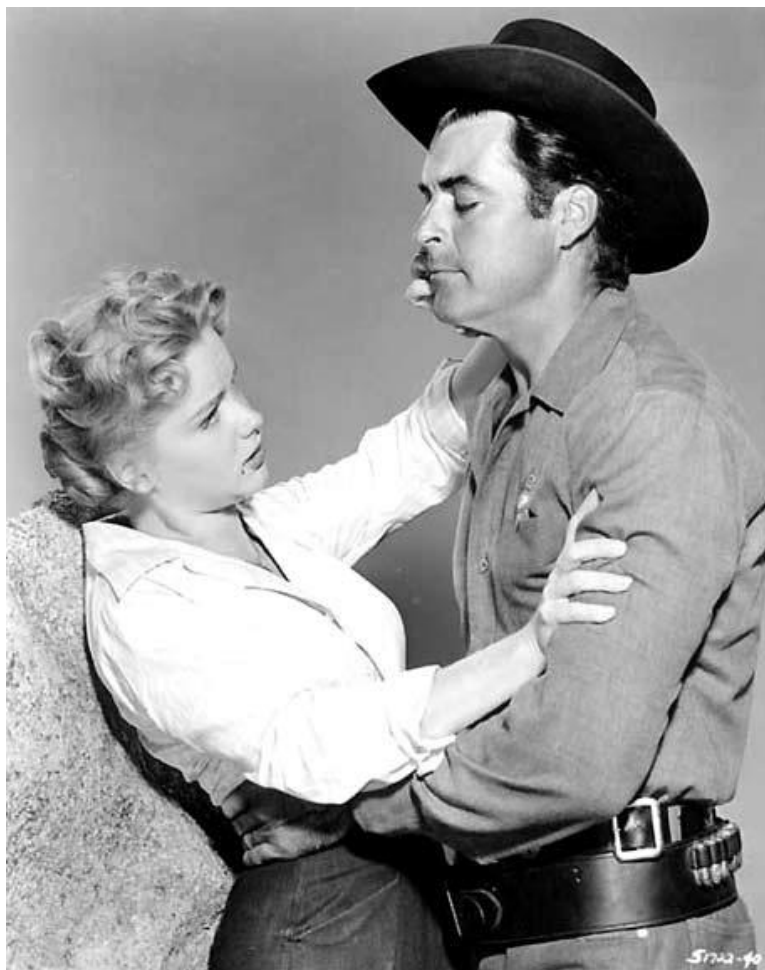
Rory Calhoun e Anne Francis no clássico The Hired Gun (Metro-Goldwyn-Mayer - 1957), western dramático rodado pelo diretor Ray Nazarro.