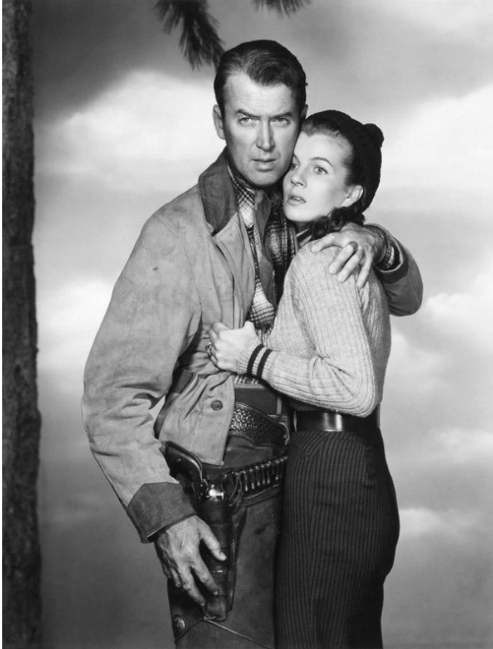
James Stewart e Corinne Calvet em The Far Country (Universal International Pictures ~ 1954), western dramático de ação assinado pelo diretor Anthony Mann.