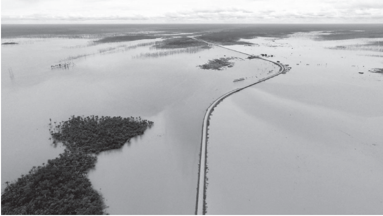
O imenso mundo aquático do Rio Madeira, de uma serena beleza.

O Madeira, agora com duas grandes hidrelétricas e atravessando territórios já colonizados por gado e soja, está passando por perigosas mudanças que devem empobrecer a sua vida exuberante. Mas não é disso que quero lhe falar, e sim de uma situação por certo impensável – a de que o Brasil seria uma ilha.