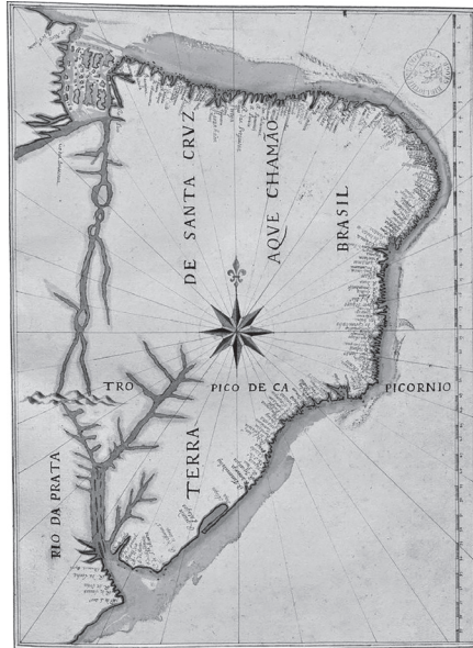
Na cartografia de João Teixeira Albernaz de 1640, o Brasil é visto como uma ilha, pois as bacias do Prata e do Amazonas se comunicam.