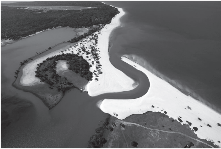
O Tapajós banha florestas de grandes árvores e praias paradisíacas, como a aqui mostrada. A mais famosa delas é Alter do Chão.

vagar por vontade própria. É um rio muscular, perigoso e sedutor, como são as suas marés, as suas florestas e as suas praias.