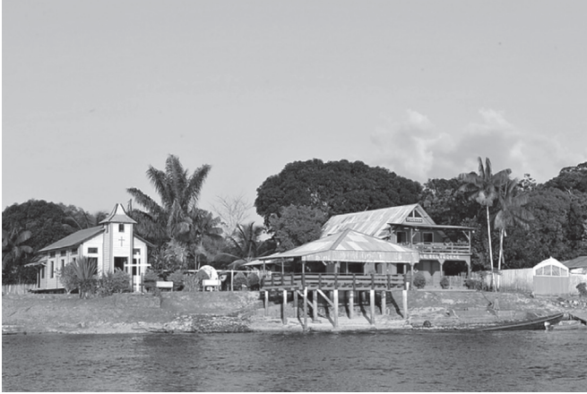
A Vila Brasil, onde o Brasil acaba.

Não foi fácil, entretanto, deixar esse lugar fascinante, com uma aura de perigo e aventura envolvendo suas pessoas errantes e suspeitas, de origens misturadas, de ocupações incertas e de expedientes ligeiros. Pessoas talvez parecidas com as águas ariscas do Oiapoque.