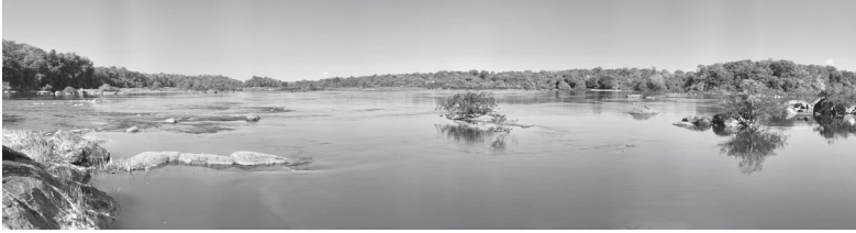
As ilhas rochosas no leito do Oiapoque, próximo à formação que o divide ao meio.

Além do ouro, foram a madeira, a castanha e a borracha que motivaram as migrações para essa região. Crioulos residentes, quilombolas fugidos, nordestinos e caboclos, junto com militares dos dois lados, vieram pelo norte francês e pelo sul brasileiro e desalojaram os índios aruak, palikor e galibi para viver do extrativismo, do soldo e do garimpo.