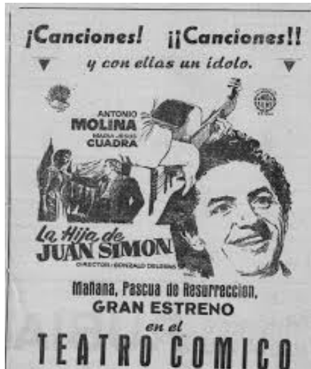
“marketing” folklórico, 1957.

Así estuve más de dos horas sin atinar a escribir nada. Luego, un poco más sereno, me fui hasta la Alameda de Colón, me senté en un solitario café para redactar unas primeras reflexiones. Ya llevaba escritas dos carillas cuando al encargado se le ocurrió poner la radio para amenizar su trabajo, mientras ordenaba la barra y fregaba tazas y vasos. Por la tela de cretona empezaron a salir los prodigiosos sortilegios de voz de mi admirado cantaor Antonio Molina, —digno heredero de los legendarios muezines andalusíes—, cantando “La hija de Juan Simón”, aquella historia del miserable enterrador, el único del pueblo, que venía de dar sepultura a su hija, y también “ de enterrar su corazón ”. Aquella canción para mí se convirtió en una especie de elegía por aquella desgraciada artista china, y me provocó una congoja que no sé explicar sobre un papel. Me pregunté que en qué lejano lugar del mundo podrían estar sus desventurados padres, porque existe una verdad indiscutible más allá de razas o credos: peor que la muerte de una hija o un hijo en la flor de la vida no hay nada.