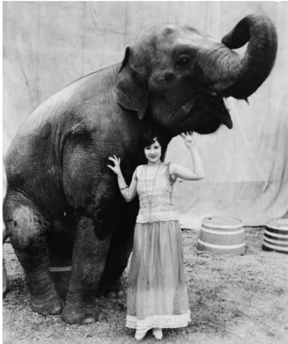
Inteligencia “versus” fuerza bruta.

El público, con los vellos como escarpas, entre los suspiros y gritos de angustia de algunas mujeres, la premiaba continuamente con unas atronadoras ovaciones.