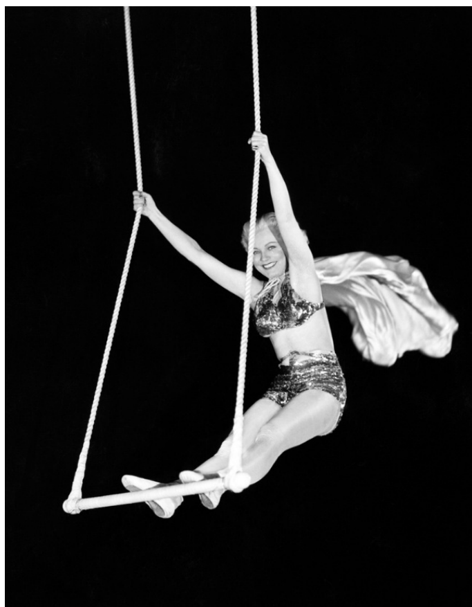
Una paloma blanca revoleadora.

¡Silencio! Señores espectadores, durante su actuación, suplicamos mucho silencio.