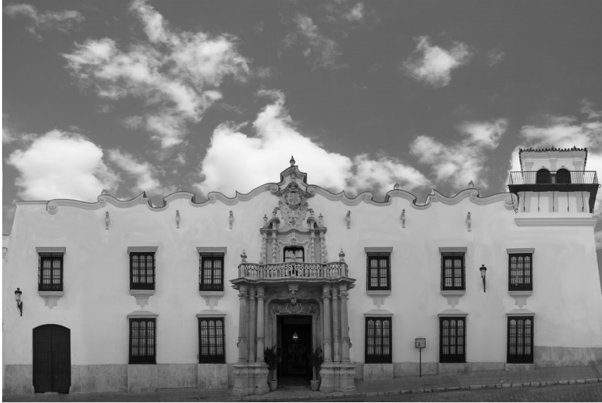
Palacio de Osuna

Aquella tarde se movía por ellas una inusual actividad de criados y camareros.