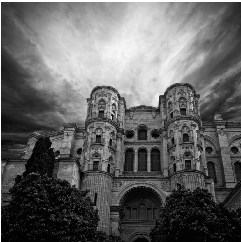
Catedral de Málaga.