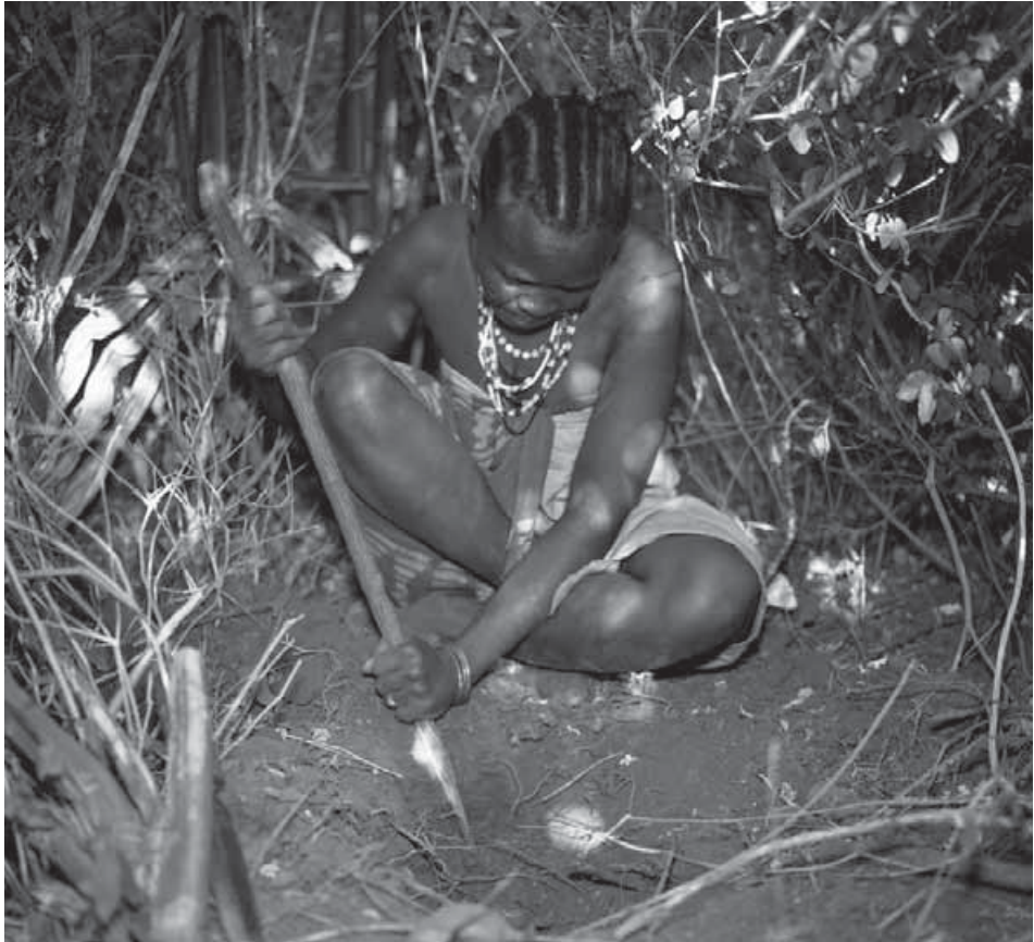
Una mujer hadza escarba en busca de tubérculos comestibles. Los hadza son una de las pocas sociedades en el mundo que siguen ganándose la vida a partir de los recursos silvestres.