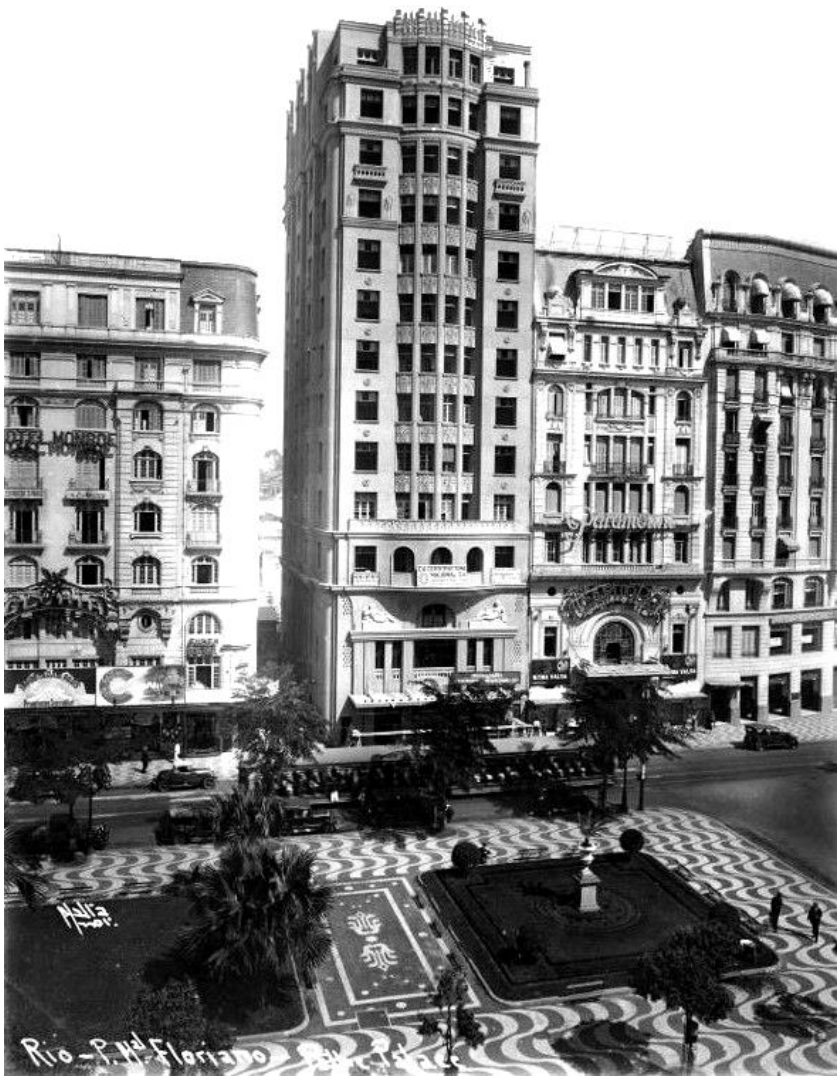
Cinelândia do Centro.