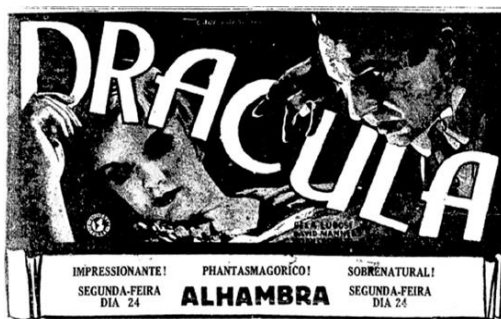
Imagem da programação do Cinema Alhambra.