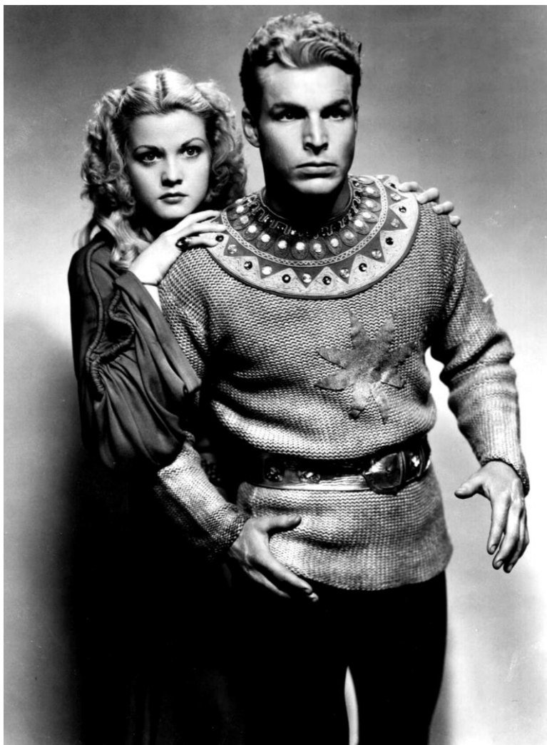
BUSTER CRABBE E JEAN ROGERS EM FLASH GORDON (1936).