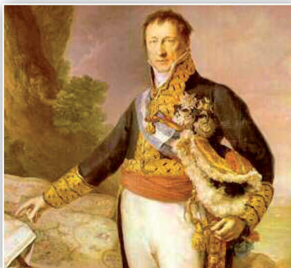
EL DUQUE DEL INFANTADO

El duque, como Regente, convocó para esa misma tarde al resto de los miembros de la Regencia: don Joaquín Mosquera y Figueroa, don Juan María de Villavicencio, don Ignacio Rodríguez de Riva y don Enrique O´Donnell, conde de La Bisbal. Todos intervinieron en animada conversación, alabando la claridad y profundidad expositiva, amén de su gracia, de los escritos de los historiadores, y apenas propusieron algún cambio. Fue una agradable y provechosa reunión, de la cual todos salieron muy satisfechos y más patriotas que antes.