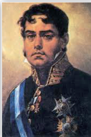
DON ENRIQUE O ´DONNELL

El duque, como Regente, convocó para esa misma tarde al resto de los miembros de la Regencia: don Joaquín Mosquera y Figueroa, don Juan María de Villavicencio, don Ignacio Rodríguez de Riva y don Enrique O´Donnell, conde de La Bisbal. Todos intervinieron en animada conversación, alabando la claridad y profundidad expositiva, amén de su gracia, de los escritos de los historiadores, y apenas propusieron algún cambio. Fue una agradable y provechosa reunión, de la cual todos salieron muy satisfechos y más patriotas que antes.