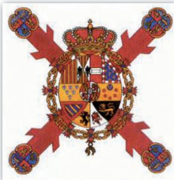
ESCUDO DE ESPAÑA EN LA GUERRA DE LA INDEPENDENCIA.

D on Manuel es convocado para que asista a una reunión de generales, en el edificio de la Capitanía General de Cádiz.