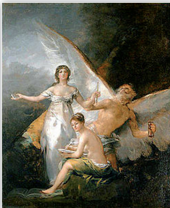
ALEGORÍA DE LA CONSTITUCIÓN PINTADA POR GOYA

L a Constitución era la nueva Ley. La habían discutido durante 4 años los legisladores más preclaros y al tiempo, los más enfrentados: liberales, progresistas, conservadores, retró-