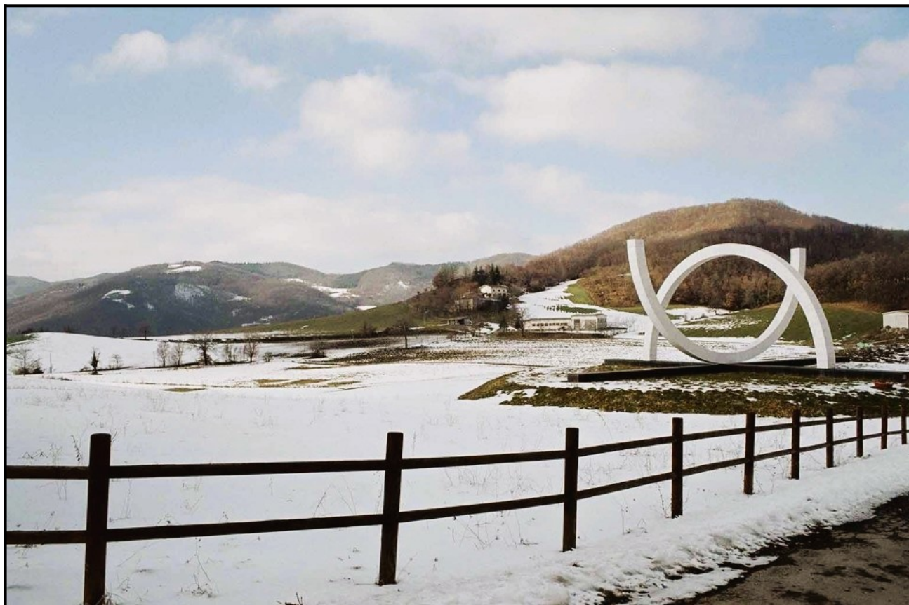
Img 2: Monumento aos brasileiros tombados na batalha.

sem antes dominar a serra que inicia no monte Belvedere (490 m de altura) até o Della Torraccia (393 m de altura), ao comparar os pontos turísticos Corcovado (altitude de 710 m) e do Mirante Dona Marta (altitude de 360 m).