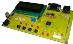
Kit didático Cerne Connect Plus

Para desenvolver este projeto foi usado o kit Cerne Connect Plus apresentado na próxima figura.