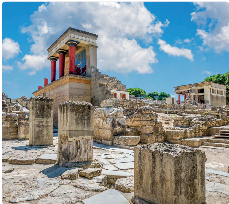
Palacio de Cnosos (p. 140).

ARRIBA: IZDA., GEORGIOS TSICHLIS/SHUTTERSTOCK ©; ABAJO: IZDA., TAGSTILES.COM - S. GRUENE/SHUTTERSTOCK ©; ARRIBA DCHA.: IULIA, N./SHUTTERSTOCK ©; ABAJO DCHA.: ANDREI NERASSOV/SHUTTERSTOCK ©.