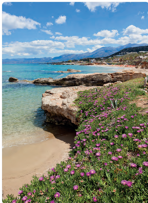
Hersonisos (p. 164).