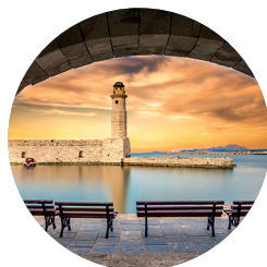
Puerto de Rétino (p. 97).