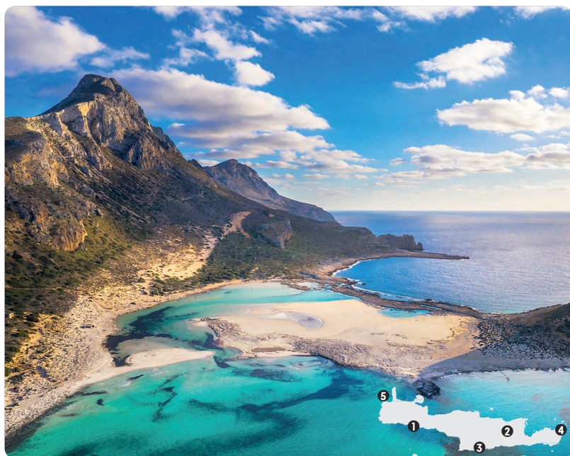
Balos (p. 89).