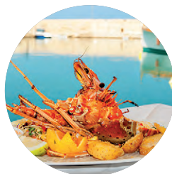
Delicias cretenses (p. 34).