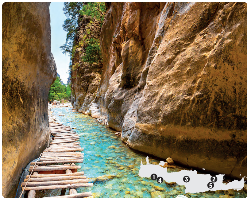
Garganta de Samaria (p. 77).