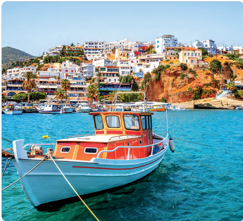
Agia Galini (p. 125).