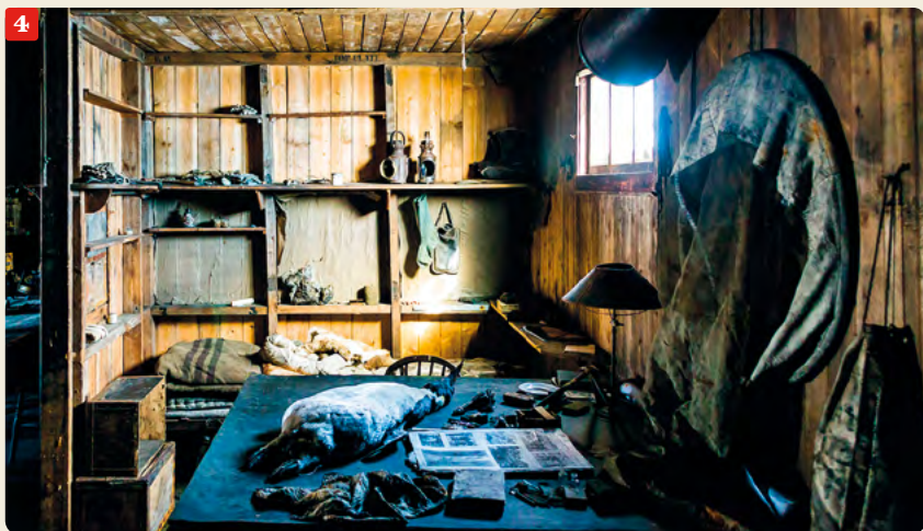
BRAND STETSON / SCOPY ©