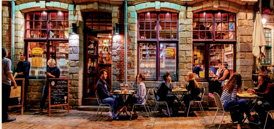
Bar en Vieux Lille.