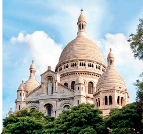
Basilique du Sacré-Cœur (París).