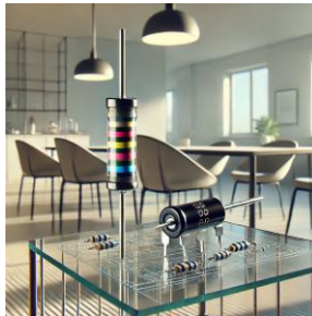
Figura 2 – linear vs digital

onde y(t) é a saída, x(t) é a entrada, e k é uma constante de proporcionalidade.