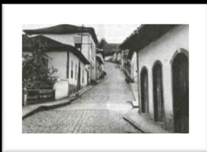
Cidade antiga de Itabira, ruas e casa familiar.