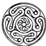
Tradição Círculo de Hécate