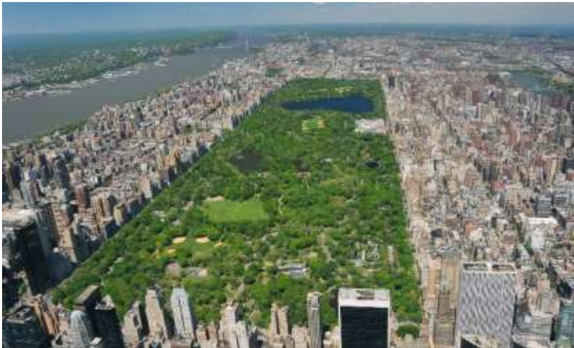
Central Park de Nova Iorque

Até meados do século XVIII o projeto de praças restringia-se ao entorno dos palácios europeus, nem sempre inseridos no contexto urbano. Os espaços livres existentes nas cidades e marcados pelas aglomerações humanas estavam, em geral, relacionados à existência de mercados populares (comércio) ou ao entorno de igrejas e catedrais. Foi somente no século XIX, que o desenho de praças entrou em cena, preconizado pelo trabalho de profissionais como Frederick Law Olmsted (projetou o Central Park de Nova Iorque).