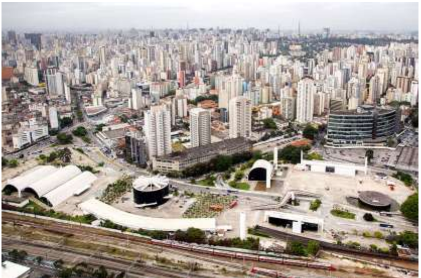
Memorial da América Latina (São Paulo)