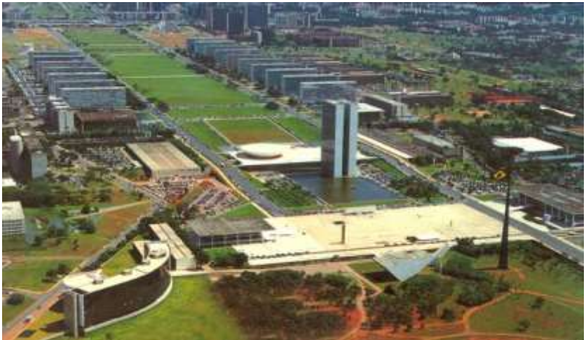
Praça dos Três Poderes (Brasília)