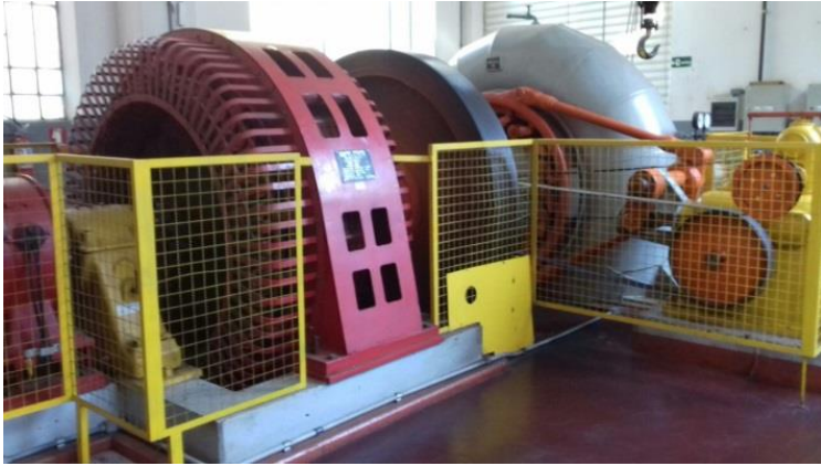
Figura 01 - gerador, Usina do Lobo, acervo do autor.

chuveiros, por exemplo, provocam os efeitos que utilizamos no cotidiano, como a luz e o aquecimento.