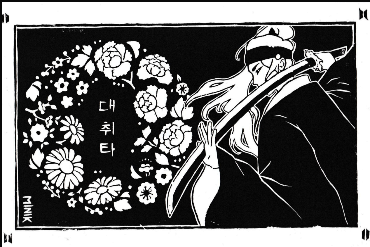
Ana Kelly - 2024