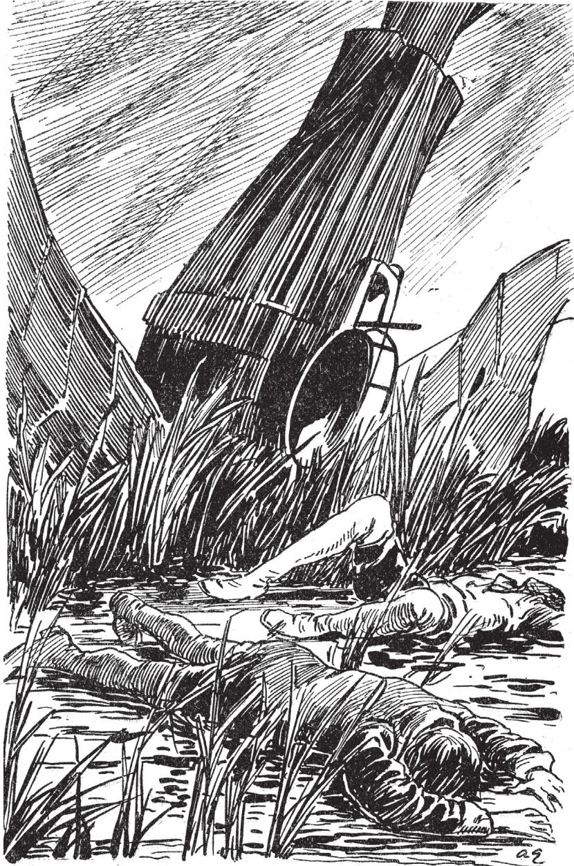
Le chevalier et son second furent projetés hors de la nacelle.

Projetés hors de la nacelle et lancés au milieu des joncs, le chevalier et son second perdaient aussitôt connaissance.