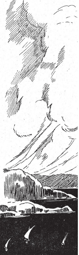
Les voiliers semblaient à peine gros comme des mouches.