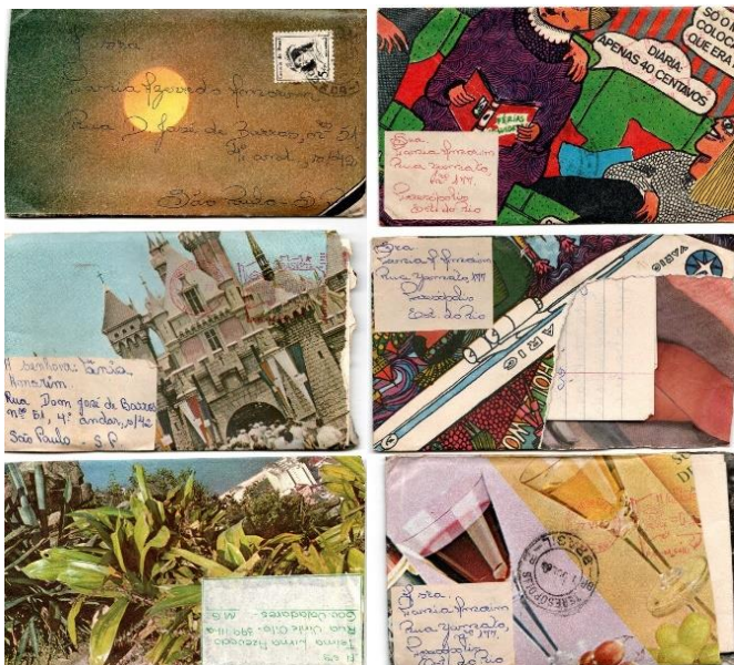
Cartas da década de 1960.