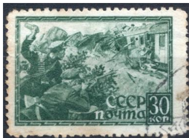
Partizans em ação. Selo Soviético de 1942