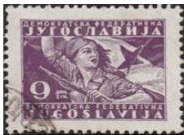
Partizans em ação. Selo iugoslavo de 1945