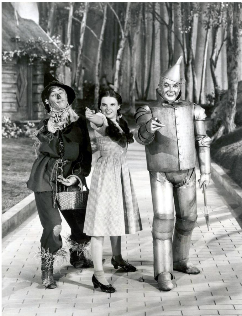
Ray Bolger, Judy Garland e Jack Haley em The Wizard of Oz (Metro-Goldwyn-Mayer - 1939).