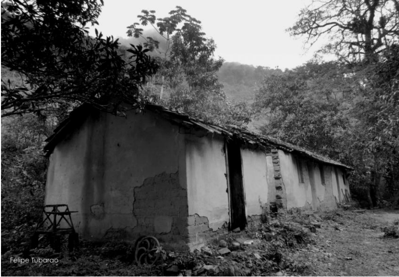
Sítio Bela Vista – Serra do Quilombo