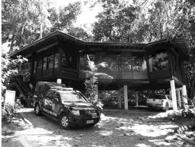
Centro de exposições – Núcleo Pau da Fome