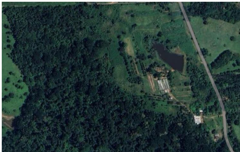
Figura 1 – Foto aérea do Sítio Ecológico Seridó, 2024.

As experiências com estufas realizadas no Sítio Seridó, levou a adotar o formato capela por ser mais resistentes a ventos fortes, podem ter lanternim, como no desenho ou ter a cobertura contínua sem lanternim.