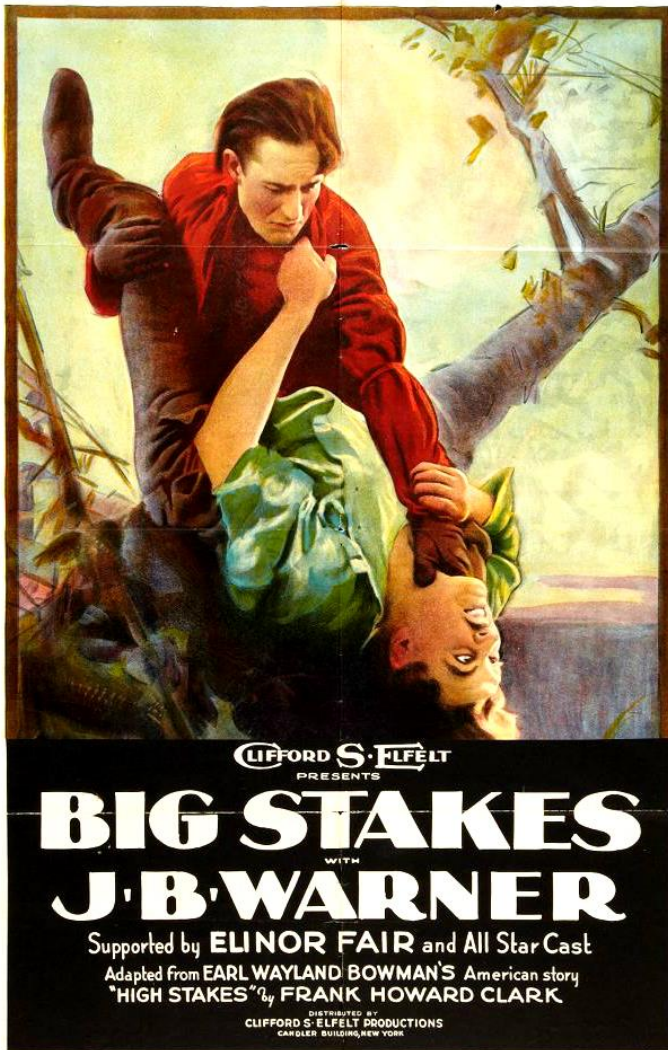
Big Stakes (East Coast Productions - 1922)