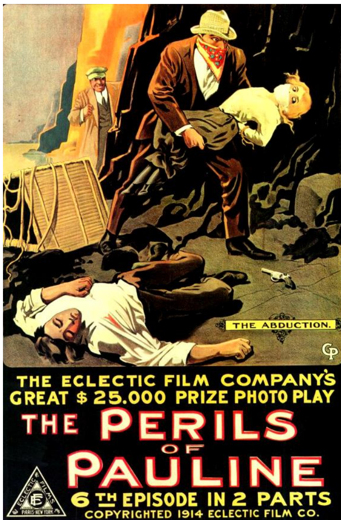
Perils of Pauline, The (General Film Company - 1914)