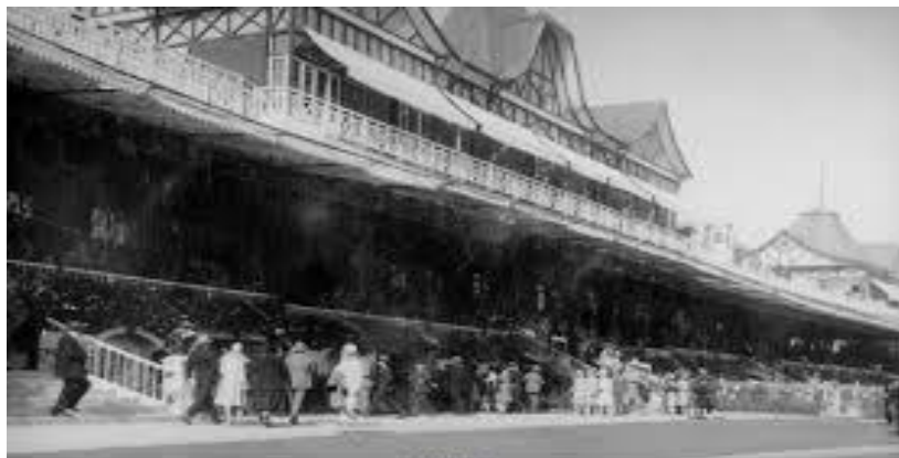
1920 Chile Sporting Club - Vina del Mar

Estádio Sporting (Vina Del Mar) Foto acima