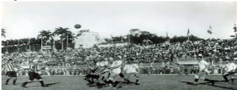
1919 Brazil - 5th turn Argentina - Brazil (1-3)