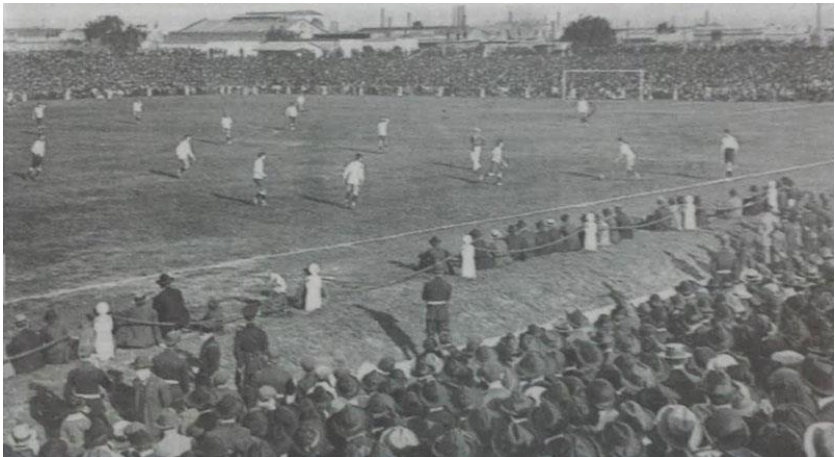
Estádio Sportivo Barracas (Buenos Aires) foto acima.

Artilheiro: Libonatti (Argentina) 3 gols.