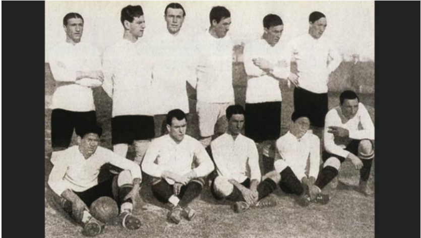
CAMPEÃO: Uruguai (1)

O Campeonato Sul-Americano de Futebol de 1916 foi a primeira edição da competição. Criada como parte dos festejos do Centenário de Independência da Argentina foi a competição internacional mais importante na América do Sul até a criação do Mundial de 1930. É também o campeonato mais antigo entre seleções. Participaram da disputa quatro seleções: Argentina, Brasil, Chile e Uruguai. Todos jogaram entre si em turno único, sagrando-se como campeão o Uruguai. A sede foi na Argentina, o estádio do Gimnasia & Esgrima foi escolhido como sede, exceto na final, quando Uruguai e Argentina jogavam aos 5 minutos o jogo teve problemas de confusão relatadas e a partida foi suspensa, retornando dia seguinte no estádio do Racing que ainda não tinha o nome atual de Presidente Peron. Na estréia os Uruguaios bateram os Chilenos por 4-0 com 2 gols de Piendibene e 2 de Gradin, enquanto a Argentina também sapecou 6-