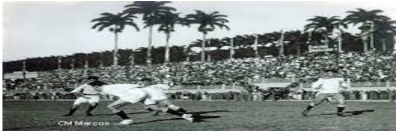
1919 Brazil - 1st turn Brazil - Chile (5-0)

OBS: Brasil e Uruguai foram ao desempate.