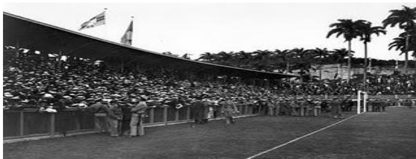
Laranjeiras (Rio de Janeiro)