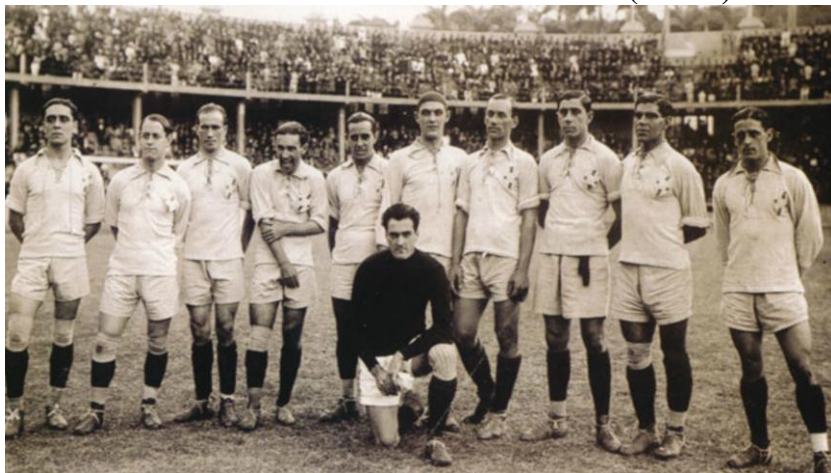
CAMPEÃO: Brasil (2)

O Campeonato Sul-Americano de Futebol de 1922, foi a sexta edição da competição. Participaram da disputa pela primeira vez cinco seleções: Argentina, Brasil, Chile, Paraguai e Uruguai. A sede foi no Brasil pela segunda vez. A disputa ocorreu em turno único, como Brasil e Paraguai acabaram empatados no turno único, houve a necessidade de um jogo desempate. A Seleção Brasileira foi a campeã pela segunda vez igualando-se ao Uruguai. Para celebrar o primeiro Centenário de sua Independência, o Brasil solicitou a organização da Copa América na CONMEBOL e foi prontamente atendido. No Rio de Janeiro, no Estádio das Laranjeiras — mesmo palco do torneio de 1919 — a Seleção Brasileira não decepcionou e ficou com o título sul-americano, o segundo de sua história, novamente como anfitrião. Sem o astro Arthur Friedenreich, na partida final, o Brasil é liderado por três campeões de 1919: Amílcar Barbuy, Neco e Heitor Domingues. A competição, que pela primeira