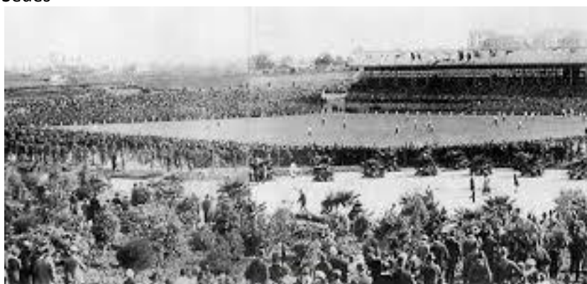
1917 Uruguay Estadio Parque Pereira - Montevideo