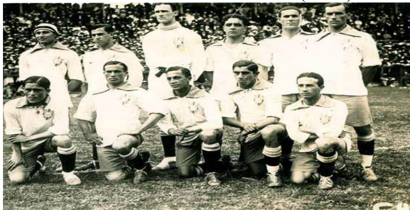
CAMPEÃO: Brasil (1)

O Campeonato Sul-Americano de Futebol de 1919 foi a terceira edição da competição. Foi disputada por quatro seleções assim como nos 2 anos anteriores: Argentina, Brasil, Chile e Uruguai. A sede da disputa foi no Brasil. Todos jogaram entre si em turno único. A Seleção Brasileira foi a campeã. O ano de 1919 foi memorável na história do futebol brasileiro. Pela primeira vez, o país organizaria um torneio da modalidade esportiva de nível internacional. Nem a epidemia de gripe espanhola tirou a felicidade dos brasileiros, em especial os cariocas. A cidade do Rio de Janeiro abrigou o 3º Campeonato Sul-Americano de Seleções de Futebol e para isso foi construído o Estádio das Laranjeiras do Fluminense. As delegações de Argentina, Chile e Uruguai desembarcaram no cais da Praça Mauá, seriam recepcionados no Clube São Cristóvão e hospedados no Hotel dos Estrangeiros. A festa teve seus contratempos, o Uruguai teve a infelicidade de presenciar o falecimento do seu goleiro reserva