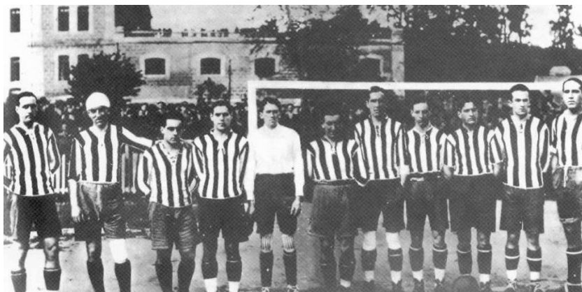
Foto: Equipe Paraguaia estreando na Copa América.