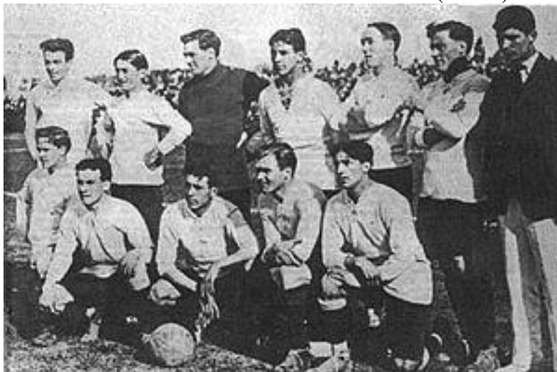
CAMPEÃO: Uruguai (2)

O Campeonato Sul-Americano de Futebol de 1917 foi disputado por quatro seleções: Argentina, Brasil, Chile e Uruguai novamente assim como em 1916. A sede da competição foi no Uruguai. Todos jogaram entre si em turno único. O Uruguai sagrou-se campeão pela segunda vez. Houve apenas uma sede para a disputa de todos os jogos, o Estádio Parque Pereira em Montevideu, que logo viria a ser demolida para dar lugar à Pista Oficial de Atletismo. Para o campeonato Sul-Americano de 1917, disputado em Montevideu, a CBD formou uma comissão técnica dirigida por Mario Pollo, dirigente da Liga Metropolitana do Rio de Janeiro, e R. Cristofaro, dirigente da APEA. Esta comissão, além de convocar jogadores que representariam o Brasil na competição, deveria, em conjunto com dirigentes da